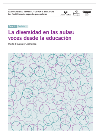
Parte 2. Capítulo 1. La diversidad en las aulas: voces desde la educación