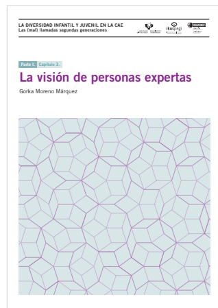
Parte 1. Capítulo 3. La visión de personas expertas