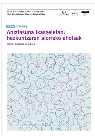
2. atala 1. kapitulua Aniztasuna ikasgeletan: hezkuntzaren alorreko ahotsak