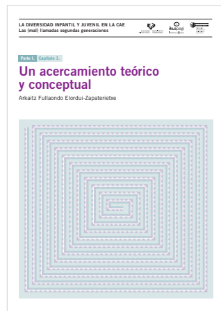
Parte 1. Capítulo 1. Un acercamiento teórico y conceptual

Estos son los capítulos publicados hasta el momento. Pincha sobre texto o imagen para descargarlos.