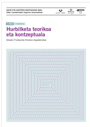
1. atala 1. kapitulua Hurbilketa teorikoa eta kontzeptuala

Hauek dira orain arte argitaratutako kapituluak. Sakatu irudi edo testuetan dokumentoak deskargatzeko.